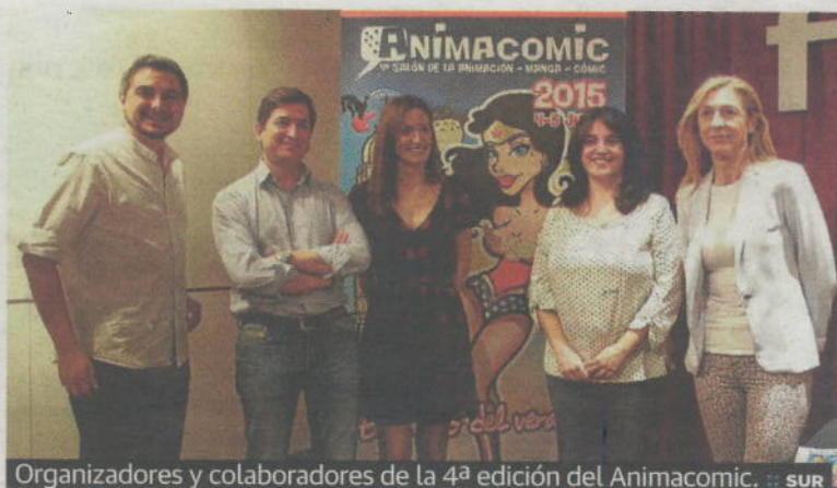
Organizadores y colaboradores de la 4ª edición del Animacomix. SUR

presión en 3D de su foto; o la exhibición de la Legión 501, un grupo de animación que emula al grupo de soldados de asalto 'stormtroopers'. Este año los asistentes podrán ser los primeros en probar los prototipos de los juegos 'Estado de sitio', 'Propagación' y 'Star Wars: al filo del imperio'.