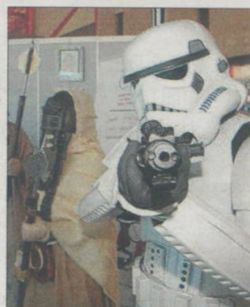
El salón del cómic de Málaga.