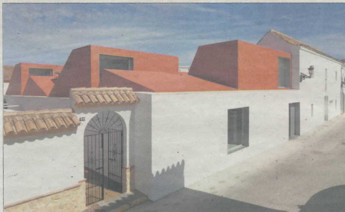
La escuela de hostelería de Medina Sidonia que obtuvo el Premio Europeo de Arquitectura Philippe Rotthier.

Durante sus dos días de celebración, 'Animacomix' desplegará sus numerosas actividades en diversos escenarios: la sala de conferencias, el escenario de Fancine, zona de miniaturas, mundo asiático o zona infantil.