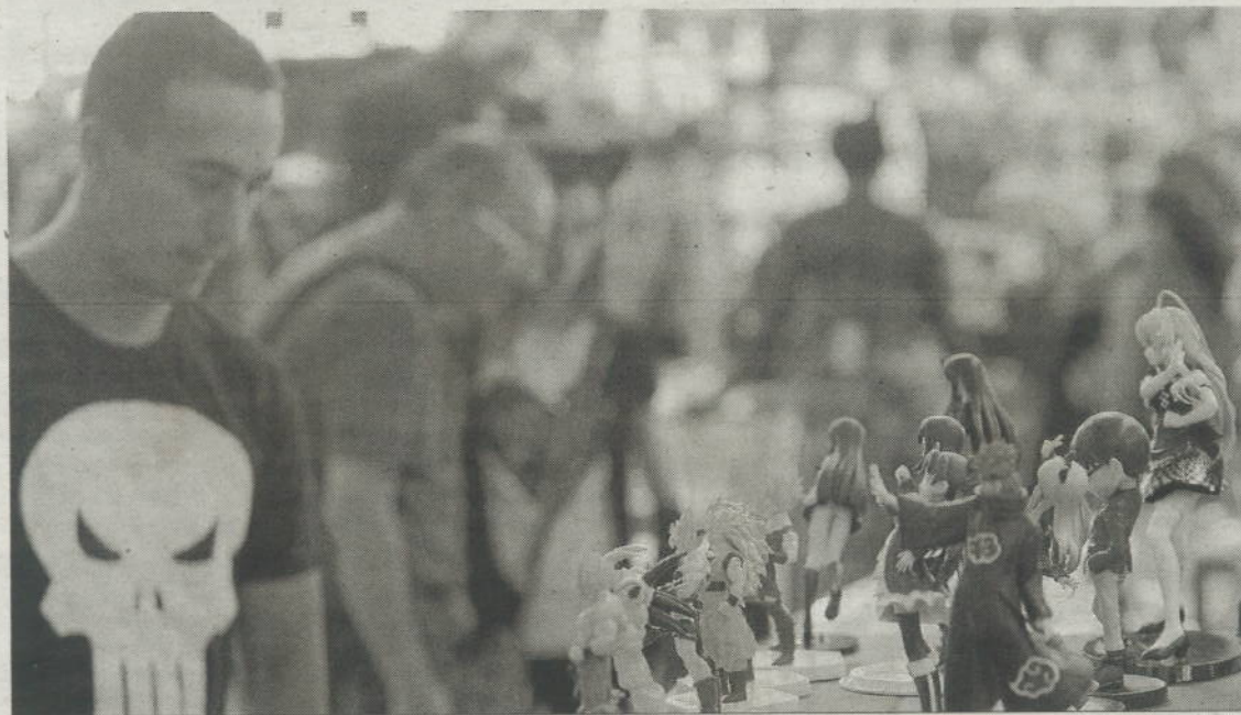
Visitantes admirando miniaturas en Animacomic 2014.

Entre todos los invitados con los que cuenta el evento hay un máximo referente del mundo del cómic: es la figura del valenciano Salvador Larroca. El dibujante es el primer español premiado en EEUU con un Premio Eisner, que en el mundo del cómic, son los Oscars de la indus-