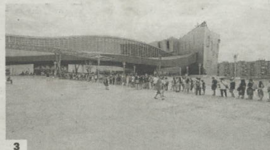
1. Dibujantes bajo la atenta mirada de una soldado de la Guerra de las Galaxias. 2. Una cosplayer posa frente a la entrada del Palacio de Ferias. 3. Las colas para entrar al evento. 4. Dos jóvenes simulan una lucha de espadas.