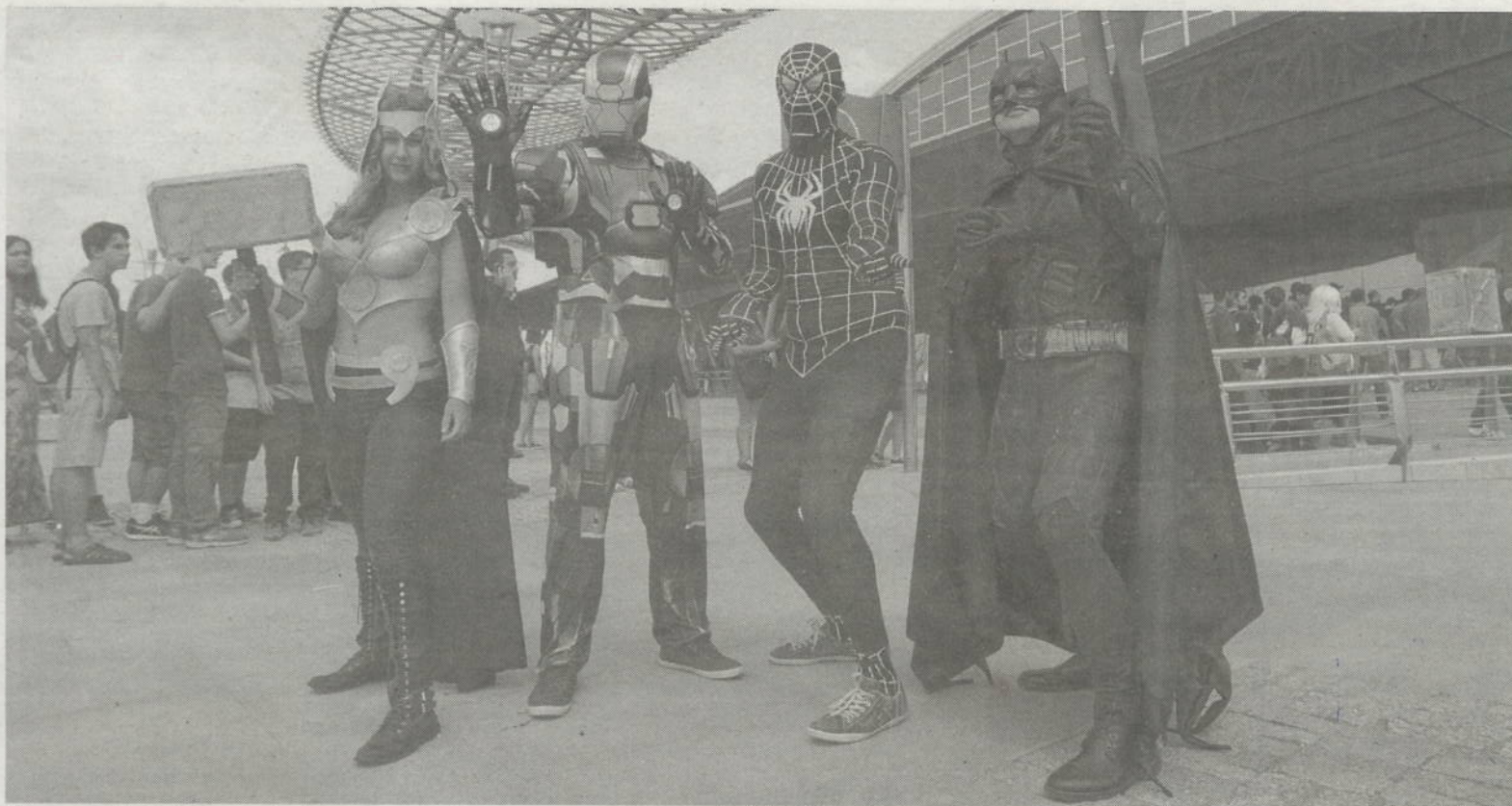
Un grupo de amigos ataviados con sus disfraces posan en la entrada del Palacio de Ferias y Congresos de Málaga, ayer.